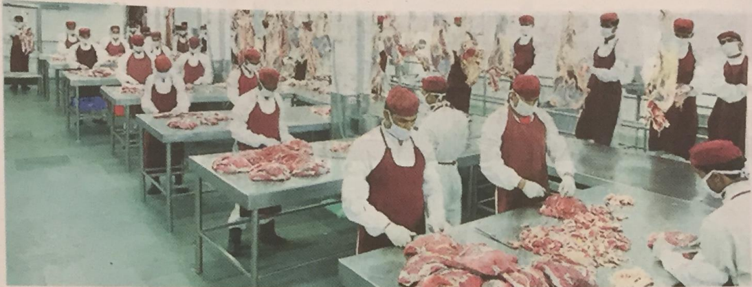
KILANG pemrosesan daging di bawah Fair Exports.