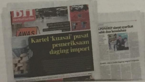
Keratan akhbar BH bulan lalu mengenai isu kartel daging import.

Isu halal bukan sahaja soal pensijilan, akan tetapi berkait soal amanah mereka yang dimandati supaya menjaga kesucian sesuatu produk untuk pengguna Muslim.