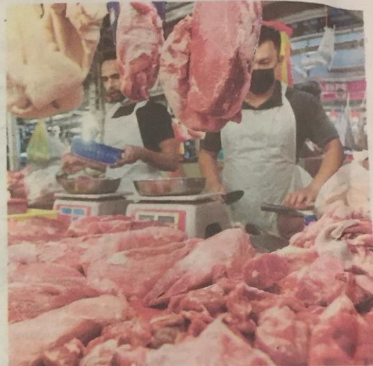
Peniaga menjual daging import berdepan kekurangan bekalan organ dalaman di Pasar Chow Kit.

la Lumpur pula mendapati, rata-rata peniaga di situ mengakui jualan daging import merosot 30 hingga 40 peratus disebabkan isu yang didedahkan akhbar.